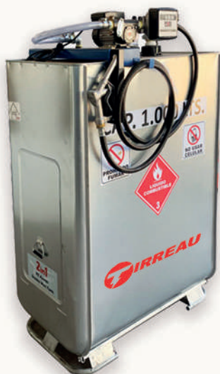
ESTANQUE DE COMBUSTIBLE DEHOUST

Contamos con una amplia gama de estanques para almacenamiento y suministro de combustible. Nuestras capacidades van desde los 450 litros hasta los 30.000 litros.