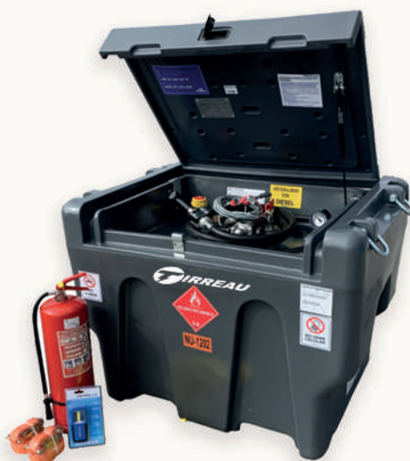
ESTANQUE DE COMBUSTIBLE TRUCKMASTER DIÉSEL 420 Y 900 LITROS.