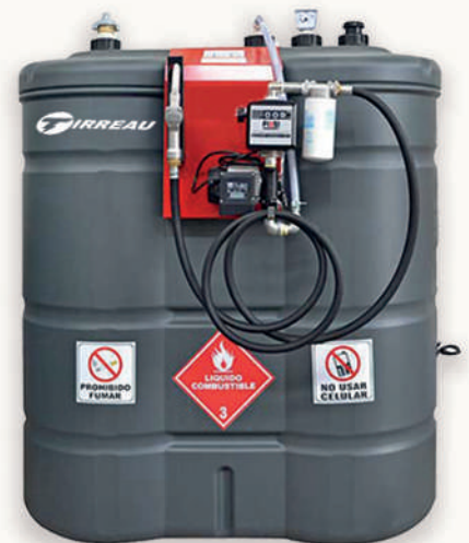
DOBLE PARED SHÜTZ TIT